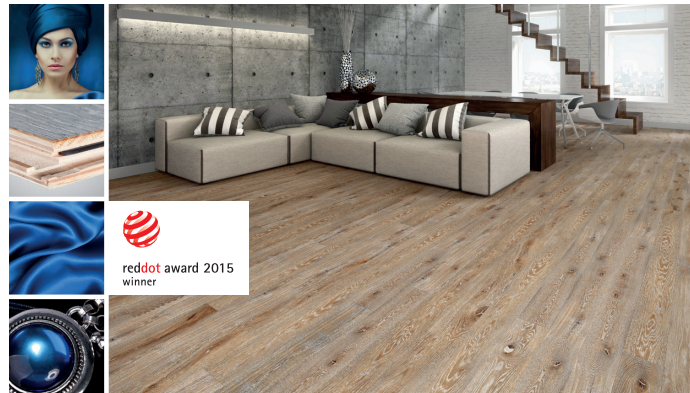
Desire z kolekcji The Miracles Collection

Baltic Wood tworzy wzory oryginalne i nowoczesne, jednocześnie nie zapominając o tych klasycznych i sprawdzonych. Dzięki temu firma w swoich 6 kluczowych kolekcjach oferuje 17 gatunków drewna europejskiego, egzotycznego i amerykańskiego oraz ponad 500 kompozycji rodzajów wykończeń (w tym oleje ECO, lakiery, bejce, szcztokowanie). Do dyspozycji jest również wiele szerokości i długości co umożliwia niemal nieograniczony wybór.