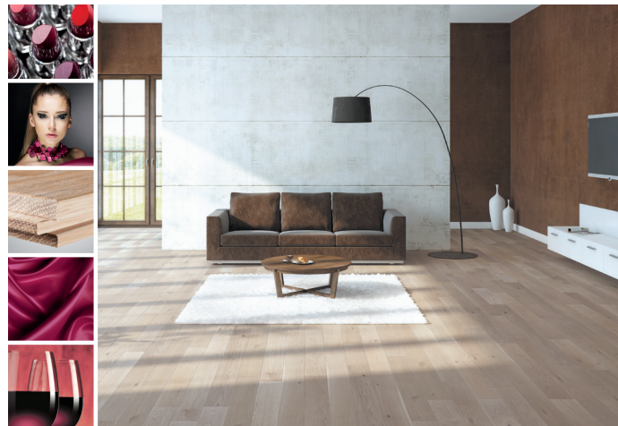
Pinot Noir z kolekcji Sélection du Sommelier