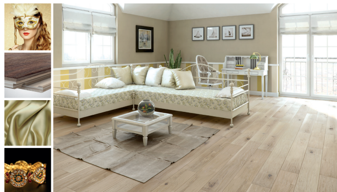
Sekrety Weroni z kolekcji Timeless Collection